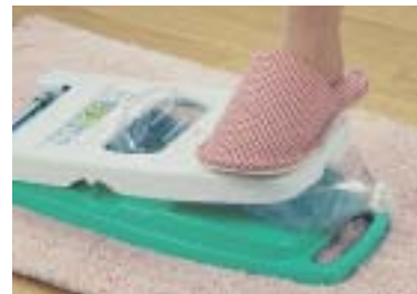
バネ付きだからラクラクプレス 軽く踏むだけでの強力仕様