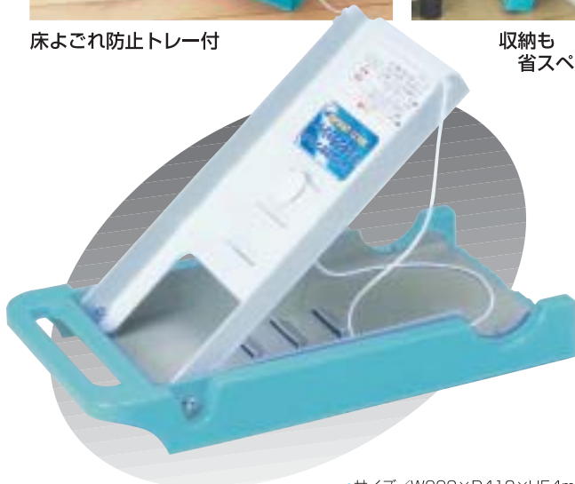
収納も 省スペース