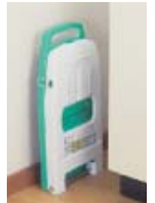
フックが付いて しっかりロック